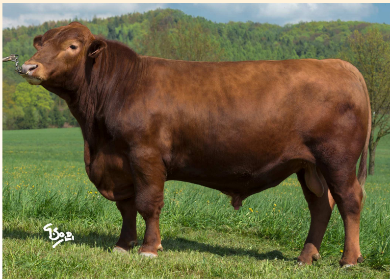
VIZIGOT ZAI 043

Vizigot se narodil v chovu ZD Brloh. Má kanadsko-americký původ. Prošel odchovem v Brlohu s přírůstkem od narození 1420 g. Při základním výběru byl velice dobře hodnocen 75 body, přičemž za užitkový typ získal 8 bodů. Vizigot má stejného otce jako další inseminační býk Paul Red ZAA 682. Otec matky Kreol Red 1M ZAA 450 je již prověřen a má skvělou plemennou hodnotu pro maternální efekt růst 115 (již 37 otelených dcer). Vizigota doporučuje do křížení i do čistokrevné plemenitby.