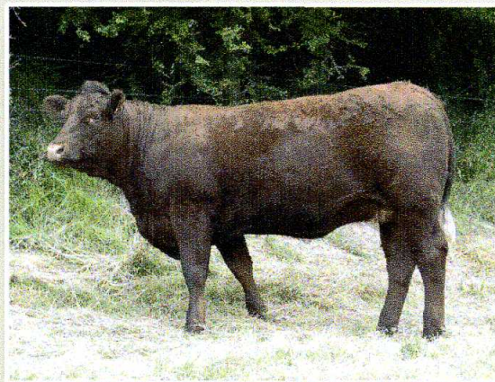
dcera Druida 21 měsíců