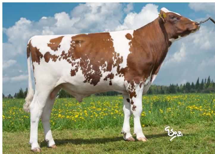
Otec Alchemista – Alchemy RC