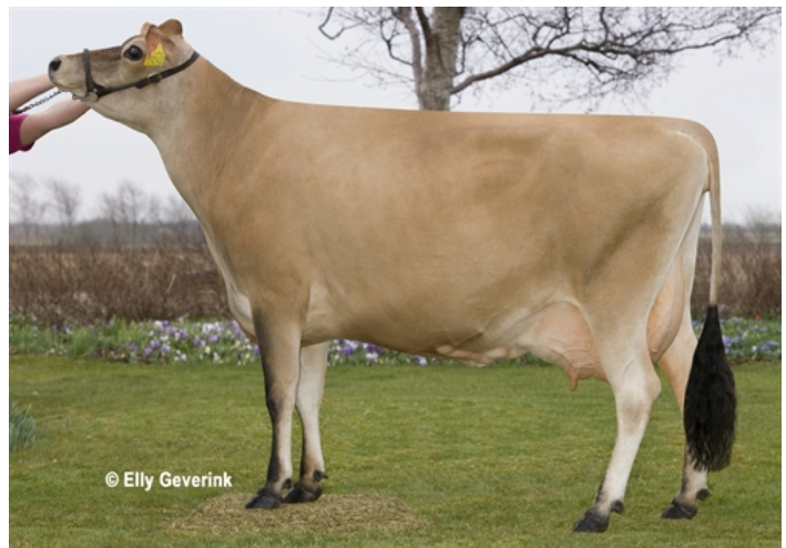
Matka DJ Impuls Violet VG 85

NATURAL, Czech Republic www.naturalgen.cz natural@naturalgen.cz