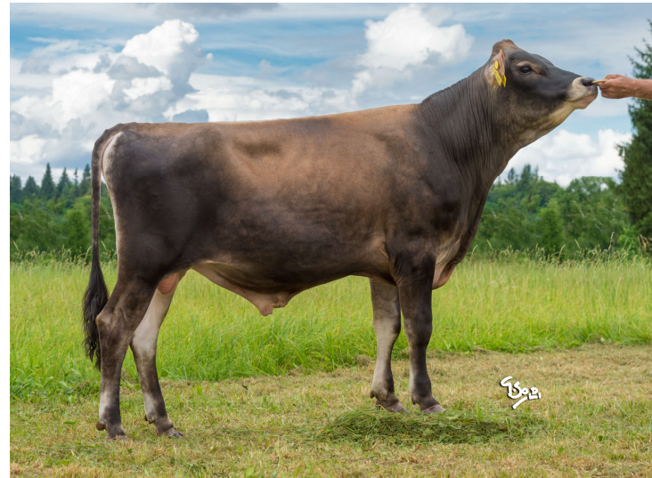
Verdi P JIM 015