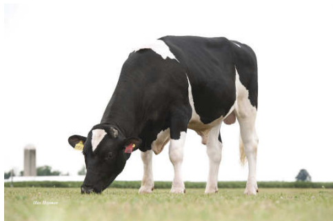
Otec Tankera Supersire