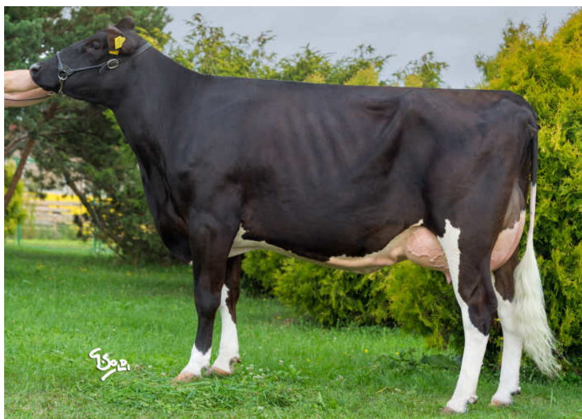
Ostretin Genua 5 ze stejné rodiny jako Tanker